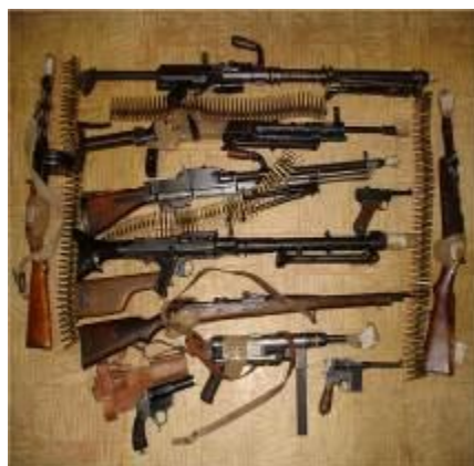
Оружие, изъятое у бандитов.

Некоторые бизнесмены готовы дать деньги террористам, чтобы устранить конкуренцию со стороны отдельных стран и областей. Например, террористический акт в курортном районе может привести к тому, что люди поедут отдыхать не туда, а в другую страну, которая и получит дополнительную прибыль. Или строители откажутся строить газопровод из-за угрозы терактов в одной стране и будут прокладывать его в соседнем регионе.