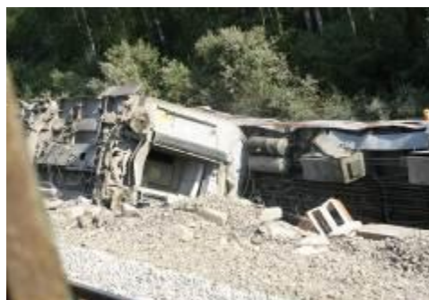
Результаты теракта на железной дороге.

Террористы часто используют оружие и взрывчатку, но это не война. Во время даже самых жестоких войн солдаты стараются не повреждать школы, больницы, религиозные здания и жилые дома. Так как на этот счет существуют жесткие правила ведения войны. Если солдат стреляет по мирным жителям, то такой солдат подлежит строгому суду и жестокому наказанию. Иначе обстоит дело у террористов. Совершая преступления, террористы выбирают такие безопасные для себя места, как больницы, школы, театры, концертные площадки, рынки. Чем больше среди людей,