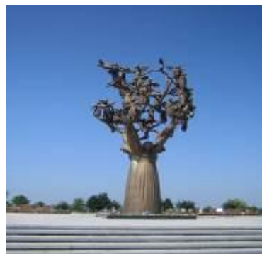
Памятник детям, погибшим во время теракта в г.Беслане.

Когда жизнь людей уносит болезнь – такова судьба или воля Всевышнего. Когда человек гибнет в автокатастрофе, причина – невыполнение правил дорожного движения. Но в случае теракта, причина – воля других людей.