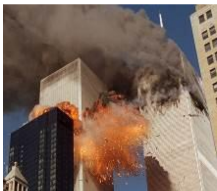
Взрыв террористами небоскребов Всемирного торгового центра в Нью-Йорке 11 сентября 2001 года.

Терроризм – слово, которое сегодня можно часто услышать. Его обсуждают между собой родственники, учителя и просто прохожие. О нем говорят в новостях по телевидению. Террористов показывают в кино и пишут о них в книгах. Взрослых очень волнует эта тема. И, наверняка, они уже говорили вам – что терроризм это большое зло. Только вот объяснить, почему же тогда нельзя взять и уничтожить это зло - непросто. Ученые и политики знают, какое это сложное явление и как тяжело его искоренить. В первой книге для младших классов вы узнали, что такое терроризм, что и зачем делают террористы, как с ними борется государство. Сейчас, когда вы уже больше знаете о мире вокруг нас и лучше разбираетесь в поведении людей, мы возвращаемся к разговору о терроризме. Ведь, для того, чтобы это страшное слово ушло из нашей жизни, надо много сделать, много знать и обладать проницательностью – уметь видеть скрытые причины поведения окружающих.