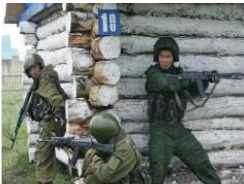
Бойцы группы антитеррора проводят учения по поиску и задержанию террористов.

Это позволяло террористам чувствовать себя безнаказанно и поощряло их к новым террористическим атакам. У современных спецслужб есть возможности не дать террористам уйти, и одновременно обеспечить максимально возможную безопасность заложникам. Большинство терактов последних лет с захватом заложников закончились уничтожением или арестом террористов.