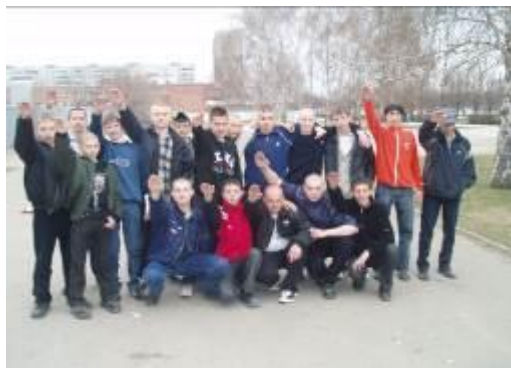
Группа подростков-скинхедов использует нацистское приветствие.

Свойственная этому возрасту идеализация, желание изменить мир, вера в свои силы и лучшее будущее, приводит к завышенности оценок и притязаний, мешает правильно оценить действительность, порождая пессимизм и апатию. Социальная активность подростка часто принимает форму абстрактной социальной критики, он фиксирует свое внимание на том, что его не удовлетворяет, что не соответствует его идеалу. Примером может служить резкость и безапелляционность критических суждений о ситуации в стране, в республике, в городе или поселке, в школе. Это состояние стараются использовать различного рода политические и религиозные течения, пытаясь внушить подростку, что все недостатки, которые он видит, могут быть устранены путем радикальных действий.