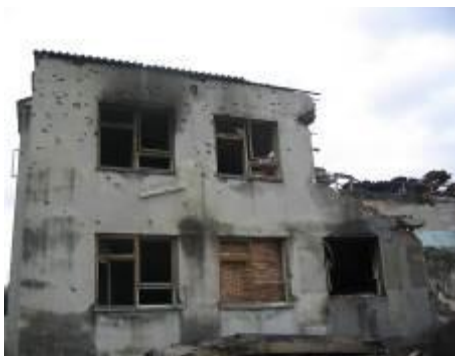
Школа, разрушенная в ходе теракта.

Первая причина, назовем ее объективной, заключается в том, что в мире есть благополучные и неблагополучные страны и регионы. В одних странах развита промышленность, транспорт, много материальных и духовных благ. В других, свирепствуют нищета, голод, болезни. Именно в таких регионах отчаявшиеся люди готовы к любым, даже непродуманным действиям. Главари террористов подсказывают – «виновники те, кто живет хорошо» и снабжают набранных «борцов» оружием и взрывчаткой. Большинство известных в мире террористов – выходцы именно из таких бедных стран и регионов. В благополучной стране возможны лишь одиночные акты психически неуравновешенных людей, но терроризм как явление слабо выражен.