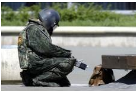
Сотрудник милиции в защитной экипировке специальной аппаратурой и исследует обнаруженный предмет.

Есть несколько практических советов, которые стоит запомнить и стараться соблюдать. Прежде всего, это касается обнаружения подозрительных предметов, которые могут оказаться взрывными устройствами. Подобные предметы обнаруживают в транспорте, на лестничных площадках, около дверей квартир, в учреждениях и общественных местах. Подросток, в силу наблюдательности, большого времени, которое он проводит на улице, в силу природной любопытности и тяги к