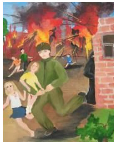
Детский рисунок теракта.