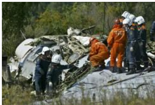
Самолет, взорванный террористами.

В современном мире, к сожалению, много страданий – болезни, преступления, экономические кризисы и войны. Когда умирает больной человек – родственники и друзья оплакивают его, когда погибает солдат с оружием – родина скорбит о нем. Но такая возможность предполагалась, ведь не все болезни мы можем лечить, а солдат, пожарный, милиционер – опасные профессии. Это печально, но соответствует тому, как люди воспринимают этот мир. Но, когда ночью по чьей-то злой воле взрывается жилой дом и погибают спящие в нем люди - рушится справедливость мира.