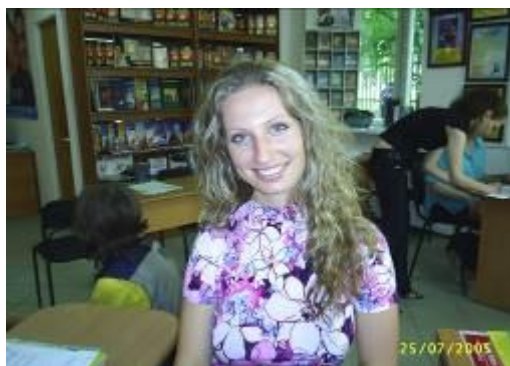
Новичков встречают улыбкой. Фото с сайта одной из религиозных сект «Саентология».

Принцип тоталитарной секты - затянуть человека в свои сети прежде, чем он что-нибудь о ней узнает. Когда же вербовщики затаскивают человека в секту, то их задача как раз обратная — «захлопнуть за ним дверь», пока он ничего еще не знает об их организации. Потому что если рассказать человеку, заполняющему «тест», что на самом деле он на долгие годы попадет в секту, будет днествовать и ночествовать в этой секте, что его могут заставить совершать преступления и почти наверняка заставят порвать со всеми родными и близкими, очень мало кто согласится пойти в эту секту.