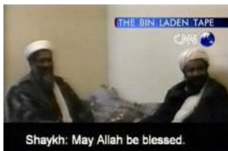
Американский телеканал CNN показывает выступление международного террориста Бен Ладена.

распространения информации и влияния на людей. Из СМИ люди узнают о мире, о мнениях, чувствах и поведении других людей. СМИ, таким образом, способно задавать настроение и определять поведение огромных групп людей. У людей есть потребность в познании окружающего мира и эту важную потребность удовлетворяют СМИ.