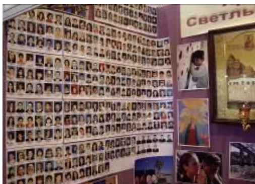
Фотографии детей и взрослых, которых террористы захватили в заложники в школе г. Беслан, а потом убили.

Прежде всего, к терроризму приходят люди с «суженным» сознанием. Они ясно, четко воспринимают, представляют одну мысль, идею. Эта может быть религиозная идея или идея мести. Все остальное в окружающем