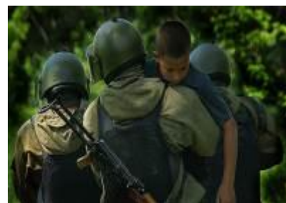
Бойцы спецназа освободили ребенка из рук террористов.