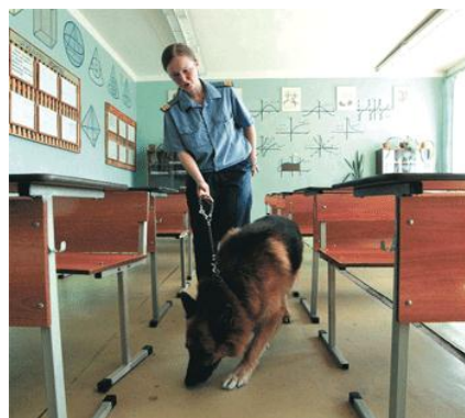
Кинолог с собакой обследует помещения школы.

➤ Каждый случай ложной тревоги тревожит мирных людей, беспокоит, мешает нормально жить. Опасаясь угрозы, эвакуируют школьников, студентов, работников предприятий, жителей домов. Перекрывают дороги, останавливают транспорт. Задерживают отправление