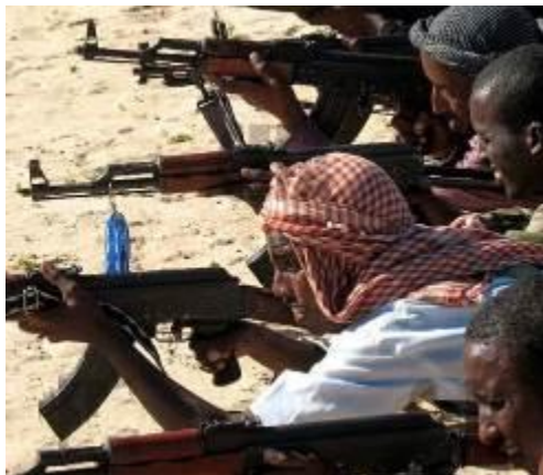
Подготовка в международных лагерях террористов.

слова «борцы за свободу», «бойцы сопротивления», «воины Аллаха», «народные мстители».